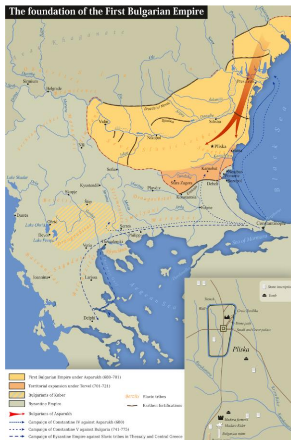
фиг. 2. Куберовите българи и Дунавска България

При вражеските нахлувания на османците българският етнос се изтегля предимно във високите котловини и близките планински масиви, за да оцелее. Изграждат се първите махали и колиби. От друга страна, част от завоевателите се преместват в обезлюдените непокътнати селища, а разрушените градове в равнините се