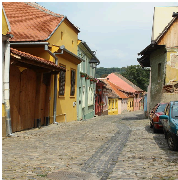
Старият град Сигишоара (Румъния), вляво и Старият град Несебър, в дясно

Една от присъщите характеристики на културната география и основна нейна