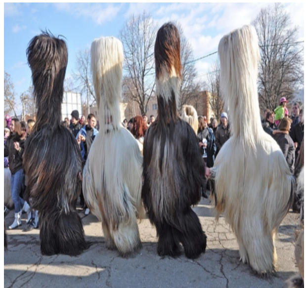
Кукери (бабугери) от Разлог

Това е същият „алгоритъм за действия” при анализ и характеризирание на обекти от