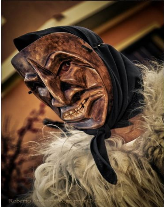
Кукери(мамутонес) от о-в Сардиния (Италия)

Културно-географската среда е факт след определен времеви период на формиране и моделиране. Тя е дефинитивно привързана към конкретна територия. За изследването ѝ често се прилага генетичния подход. Това е общонаучен метод, който цели да обясни различните процеси и явления в Кукер