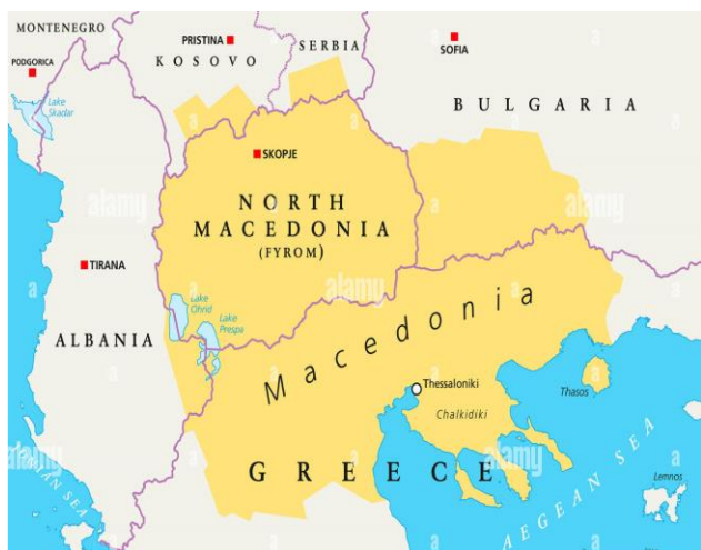
Фиг. 1. Контури на историко-географска Македония